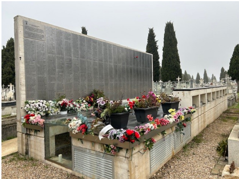
Memorial del cementerio El Carmen en honor a las víctimas del franquismo